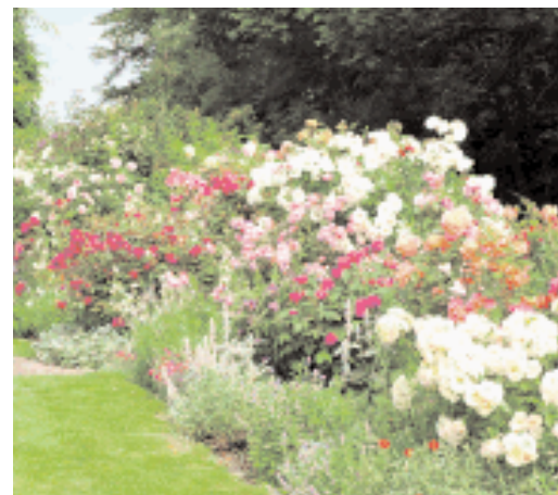
Paradiesisch: Die passionierte Gärtnerin aus Galgenen trägt Blumen und Bienen grosse Sorge.